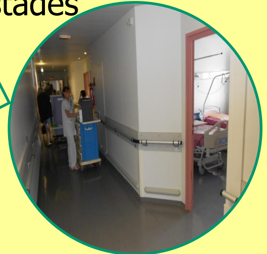
Service de soins continus Kit d'urgence et suivi