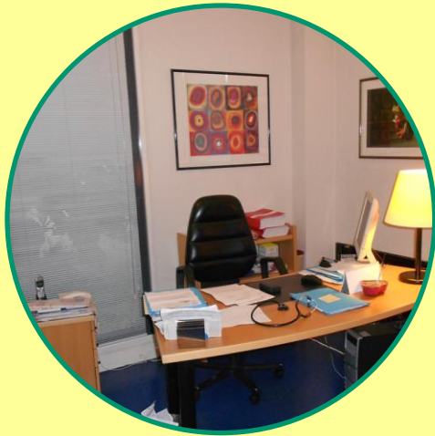
Consultation hospitalière ou de ville 1 fiche infos / 1 n° tél 0321887310