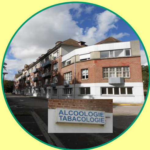
Prise en charge et suivi