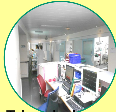
Tabacologie Hospitalisation en Soins Intensifs et cardiologie